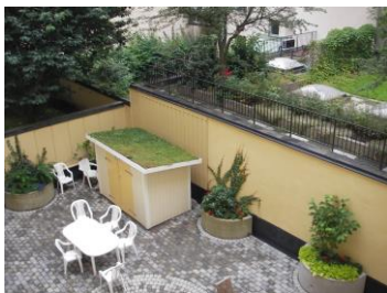
Liten gård med förrådsbod som fått ett vackert och praktiskt tak med Sedumväxter vid Kommendörsgatan.

Givetvis gör vi stenläggningar, murarbeten, trappor m.m. liksom träarbeten som förrådshus, cykelstall, träck, spaljéer och andra snickerier. I samarbete med yrkesskickliga partners drar vi el och vatten till de platser på gården där så behövs.