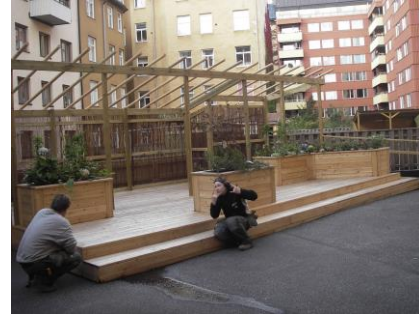
Däck i lärkträ med integrerade planteringslådor och pergola vid Grindsgatan.

Stadsträdgården har även stor erfarenhet av mer avancerade anläggningsarbeten som t.ex. dräneringar och grundisolering. Vi utför brunns- och dagvattenrör byten, länkar stuprör direkt till brunnar under jord för att slippa hela takytans vattenmängd direkt ut på gården etc.