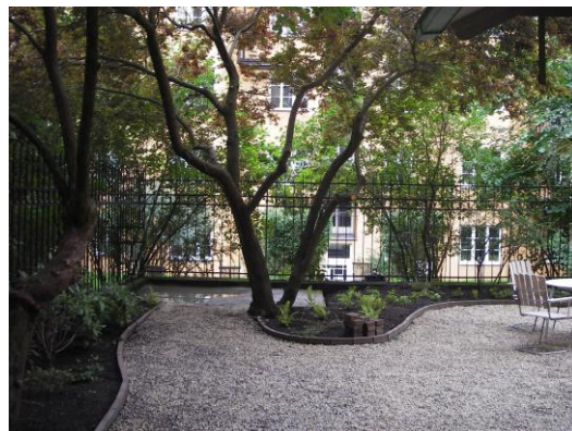
Nyanläggning men ändå med bevarande av de gamla träderna vid Eriksbergsgatan.