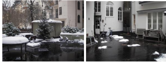
Så här såg det ut innan vi började!