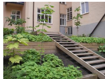
Gammal och ny trapplösning i en brant slänt som även fått stödmurar vid Linnégatan.