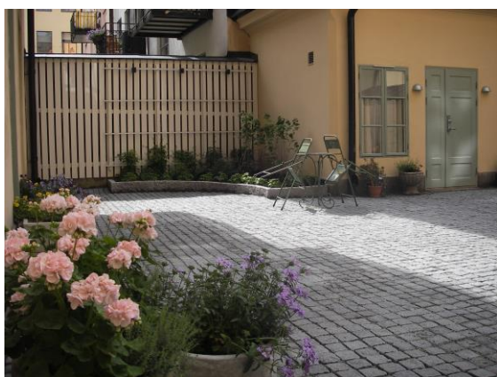
En nyanlaggd gård med Parisisk känsla vid Karlavägen.

Efter att vi kommit överens om projektet och lagt en tidsplan påbörjas anläggningsarbetet. Vi arbetar med egen personal i såväl anläggning som underhåll. Till vissa arbeten, som t.ex. el- och vatteninstallationer och underliggande valv och tätskikt vid underbyggda gårdar etc., samarbetar vi med marknadens mest professionella partners som underentreprenörer.