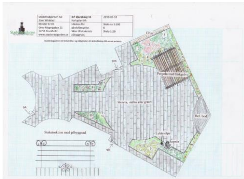
Skiss till anläggningen på första sidan, trädgård på ett garagetak vid Karlavagn.