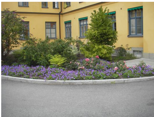
En del av en frodig parkanläggning vid Högalidsgatan.

Vi på Stadsträdgården har lång erfarenhet av trädgårdsdesign och anläggning i de krävande och speciella miljöer som innergårdar utgör. Det gäller inte bara att skapa en vacker och funktionell gård på papperet, utförandet och skötseln måste ske med kunskap och omsorg.