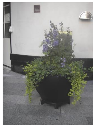
Även vackra urnor för sommarblommor ingår i Stadsträdgårdens sortiment.